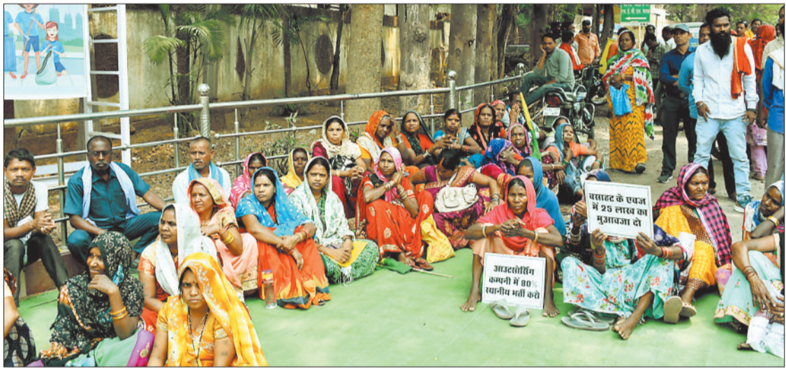
एसईसीएल मुख्यालय के सामने अपनी मांग को लेकर घरने पर बैठे भूविस्थापित।