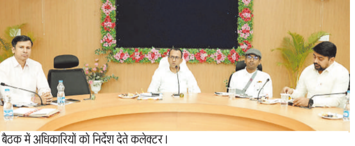
बैठक में अधिकारियों को निर्देश देते कलेक्टर।

■ सचिव, पटवारी, आरईओ को मुख्यालय में निवास करने के निर्देश