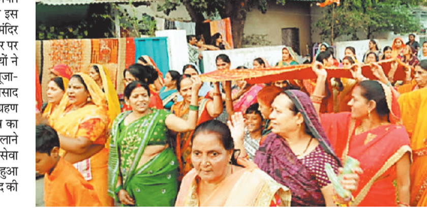
मां मड़वाराणी में भक्तों का लग रहा तांता