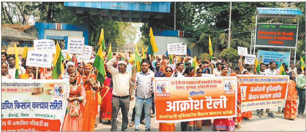
एसईसीएल मुख्यालय के मुख्यद्वार पर तालाबंदी कर धरना प्रदर्शन करते भूविस्थापित।

हरिभूमि न्यूज कोरबा एसईसीएल की सभी परियोजनाओं से प्रभावित भूविस्थापितों ने रोजगार, पुनर्वास सहित अन्य मांगों को लेकर एसईसीएल