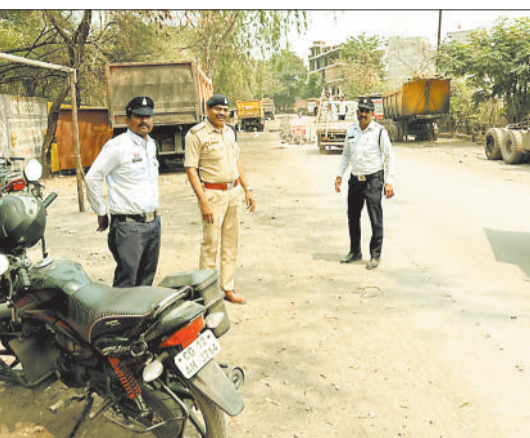
कार्यवाही करते पुलिस व निगम अमला।