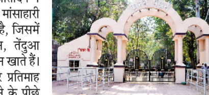
114.636 हेक्टेयर क्षेत्र में फैले कानन पेण्डारी जू में 65 प्रजातियों के 650 से अधिक मांसाहारी और शाकाहारी वन्यप्राणियों के लिए अलग-अलग केज की व्यवस्था प्रबंधन ने की हुई है,

बिलासपुर। कानन पेण्डारी जू में प्रतिदिन 1 लाख रुपए से अधिक शाकाहारी और मांसाहारी वन्यप्राणियों के आहार में खर्च होता है, जिसमें मांसाहारी वन्यप्राणी टाइगर, लायन, तेंदुआ सहित अन्य वन्यप्राणी 180 किलो मटन खाते हैं। वहीं 8 से 9 लाख रुपए का आहार प्रतिमाह शाकाहारी वन्यप्राणियों को आहार देने के पीछे खर्च किया जाता है।