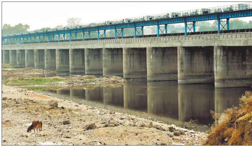
परियोजना में देरी और अधूरे काम के कारण इसका रिनुवल प्रस्ताव भेजा गया था जिसमें शिवघाट प्रोजेक्ट के लिए 20.17 करोड़ और पचरीघाट प्रोजेक्ट के लिए 17.42 करोड़ रुपए की मंजूरी मिली है। अब दोनों बैराज की कुल लागत 90.90 करोड़ से बढ़कर 127.95 करोड़ रुपए हो गई है।

शिवघाट और पचरीघाट में बन रहे दोनों बैराजों का काम कब पूरा होगा और इसे कब शुरू किया जाएगा यह बताने वाला कोई नहीं है। हाल यह है कि पहले ही दो साल लेट हो चुके इस परियोजना में पिछले करीब साल भर से काम बंद है। इसकी लागत भी 37 करोड़ रुपए बढ़ गई। हालांकि अधिकारियों का कहना है कि जल्द काम शुरू करते हुए इसे पूरा कराया जाएगा। हालांकि पहले कहा जा रहा था कि 2023 मार्च तक प्रोजेक्ट को पूरा कर लिया जाएगा। इसमें लाइनर और स्ट्रक्चर का काम पूरा करना था, लेकिन ऐसा नहीं सका। जिस तरह प्रोजेक्ट का काम धीमी रफ्तार से चल रहा है इससे अभी तय डेडलाइन में प्रोजेक्ट के पूरा होने में संशय है। पचरीघाट में निर्माण कार्य सबसे ज्यादा धीमा है।