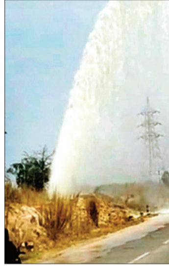
क्षतिग्रस्त पाइपलाइन से निकलता पानी का फव्वारा।

जिले के कोहड़िया क्षेत्र में घंटों तक पानी सप्लाई के लिए बिछाए गए पाइपलाइन